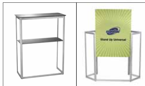
Die Grafikplatten sind montiert und verbleiben im Rahmen während des Transportes.