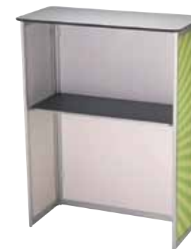
Reichlich Platz zum Verwahren von Informationsmaterial.