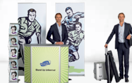
Kombination #4 Brochure Stand Double + Roll Up Professional + Stand Up