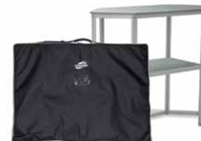
Das Stand Up-Paket enthält Thekenrahmen, Thekenplatte, Zwischenboden und gepolsterte Transporttasche aus Nylon mit Schulterriemen.